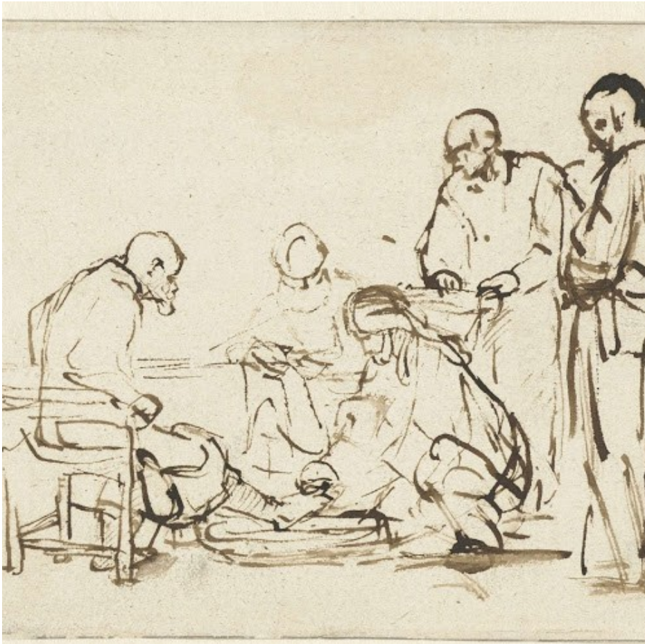
Rembrandt Harmensz. van Rijn